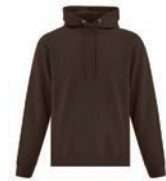
BRUN CHOCOLAT FONCÉ 412C