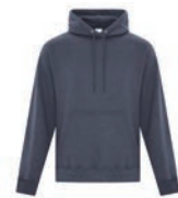
MARINE CHINÉ 2379C