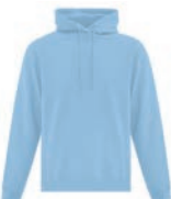
BLEU PÂLE 278C