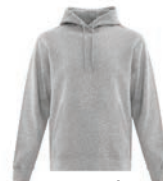
CHINÉ ATHLÉTIQUE Cool Grey 5C