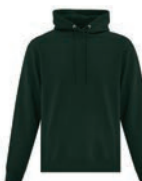
VERT FONCÉ 5467C