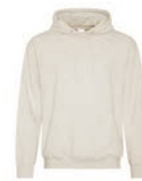
AVOINE CHINÉ Warm Grey 2C