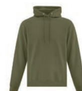
VERT MILITAIRE 7771C