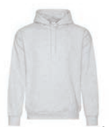
GRIS CENDRÉ Cool Grey 3C