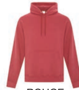
ROUGE CHINÉ 193C