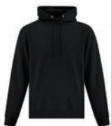
NOIR Black 6C

Les couleurs des tissus textiles sont sujettes aux variations du lot de teinture et ne correspondront pas exactement à la référence Pantone imprimée.