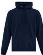
MARINE FONCÉ 296C