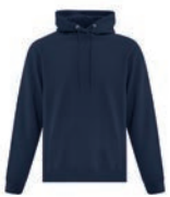
GRIS FONCÉ CHINÉ 7540C