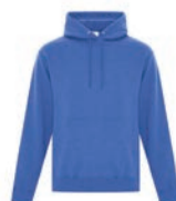
ROYAL CHINÉ 2130C