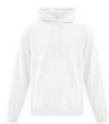
BLANC Aucun PMS